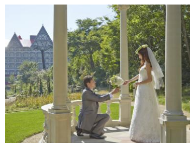
[イングリッシュ・ガーデンウェディング]