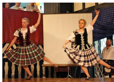
[Scottish Highland Dancers]