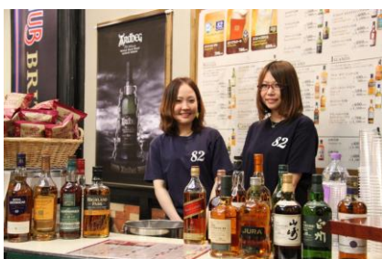
[82ALE HOUSE Produced by HUB]

本場スコットランドからバグパイプ演奏やハイランドダンス、日本から和太鼓演奏や沖縄三線、キッズダンサーまで！！そして本格式英国PUBのHUBがプロデュースのリアルエールが味わえます。その他には新郎・新婦との初コラボ、イングリッシュガーデン・ウェディングで幸せのおすそわけ。見て・楽しめるプログラムが盛り沢山。白馬の夏を是非お楽しみ下さい♪