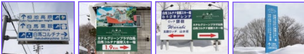
5 経路途中の2.0km地点に設置。越えたらすぐ⑥が。 6 T字路の角建物前に設置。これを右折。 7 経路途中わらび平グレンデ入口に設置。 8 最後、白馬コルチナリゾート入口の看板。

※安曇野(旧豊科)・長野インターチェンジからお越しのお客様は①の看板すぐのT字路を左折、糸魚川インターチェンジからお越しのお客様は①の看板すぐのT字路を右折して下さい。豊科・長野方面からお越しの場合、①の看板を越えJRN南小谷駅に向かう途中に白馬コルチナの看板がありますが、この道は高低差がはげしく道幅も狭いのでご案内している経路をご利用下さい。また、糸魚川方面からお越しの場合もご注意ください。