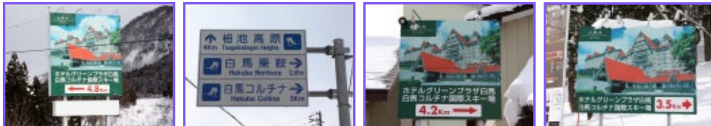
1 国道148号線沿いに設置。この看板を目印に曲がる。 2 小谷小学校校舎を右手に越えたすぐ頭上に設置。 3 T字路の角、民家の前に設置。これを右折。 4 経路途中の3.5km地点に設置。越えたとすぐ橋が。